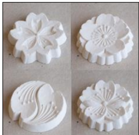
上質な材料から作られた吉野本葛菓子 →

夫婦とパート一人の小規模店であるが、少人数なりのコミュニケーションの良さや柔軟性を生かした経営を心掛けている。